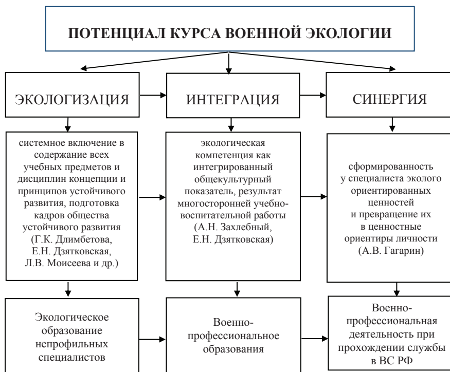
Рис. 3. Этапы реализации потенциала курса военной экологии