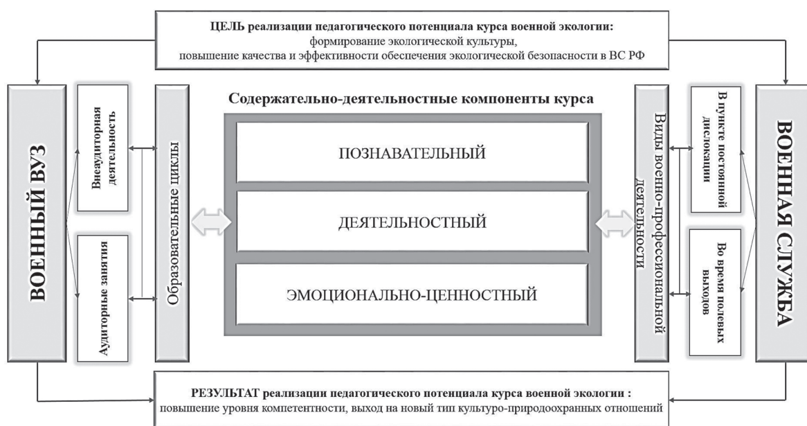
Рис. 4. Модель реализации совокупного действия ресурсов образовательной среды военного вуза и военной службы