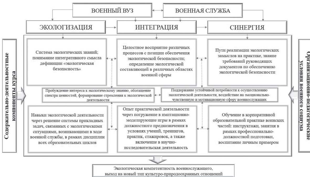
Рис. 5. Взаимосвязь содержательно-деятельностных компонентов на разных этапах реализации педагогического потенциала курса военной экологии