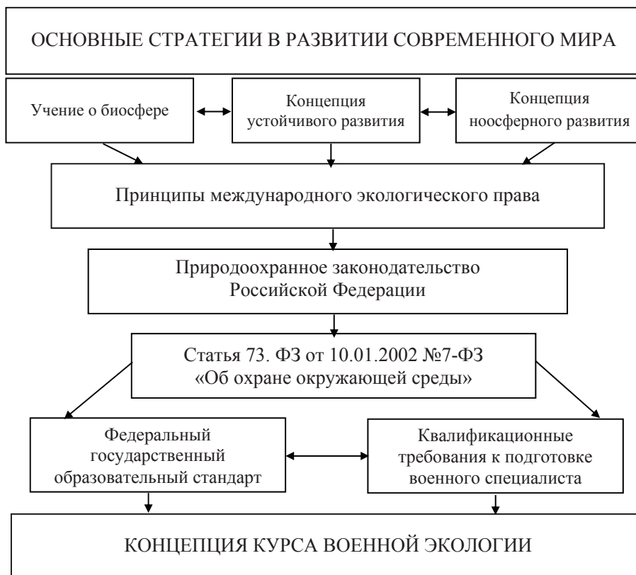
Рис. 2. Формирование концепции курса военной экологии