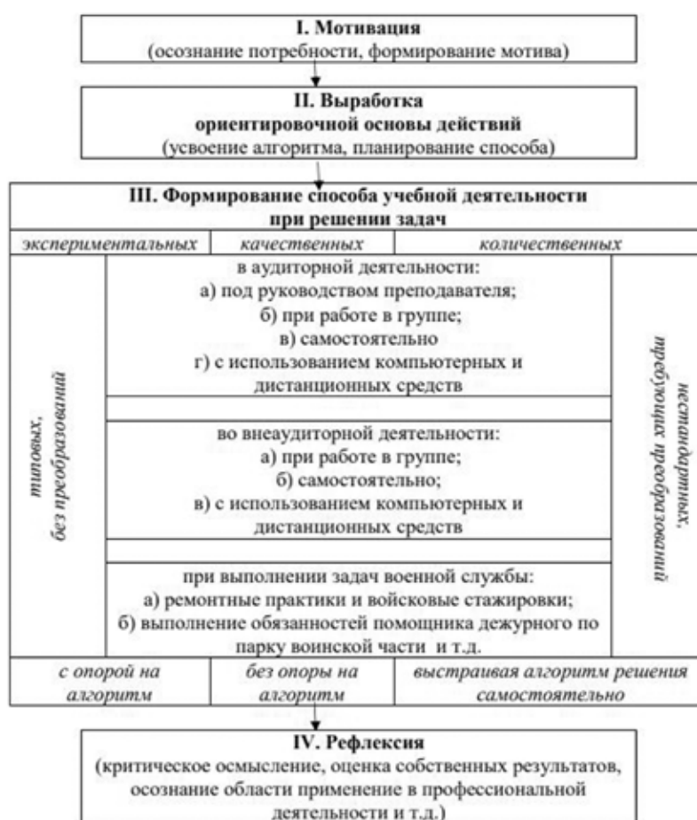
Рис. 2. Соотнесение этапов и форм использования учебных задач в образовательном процессе

слоя воздуха в рабочей зоне ПТОРа спустя 10 минут работы двигателя внутреннего сгорания на холостом ходу. Реализация междисциплинарных связей с дисциплинами: «Термодинамика и теплопередача» в части актуализации сведений о влиянии на уровень выбросов вредных веществ с отработавшими газами в атмосферу режима работы двигателя; «Эксплуатация и диагностика военных гусеничных и колесных машин (ВГ и КМ)» в части актуализации сведений об организации работы в парке».