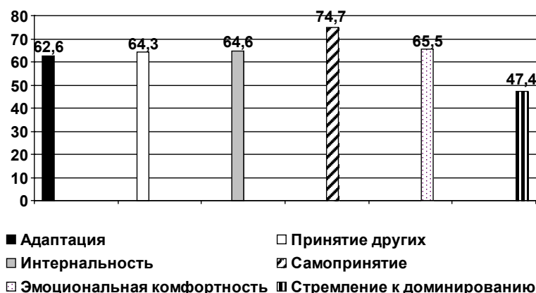
Рис. 3. Сравнение средних значений по шкалам методики социально-психологической адаптации

торых осуществляется целенаправленный анализ ситуации и возможных вариантов поведения, происходит выработка стратегий разрешения проблемы, планирование собственных действий с учетом объективных условий, прошлого опыта и имеющихся ресурсов.