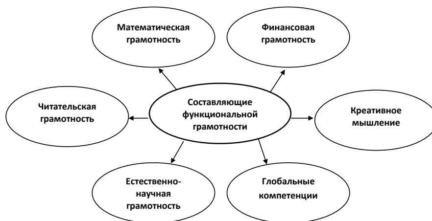
Рис. 2. Составляющие функциональной грамотности